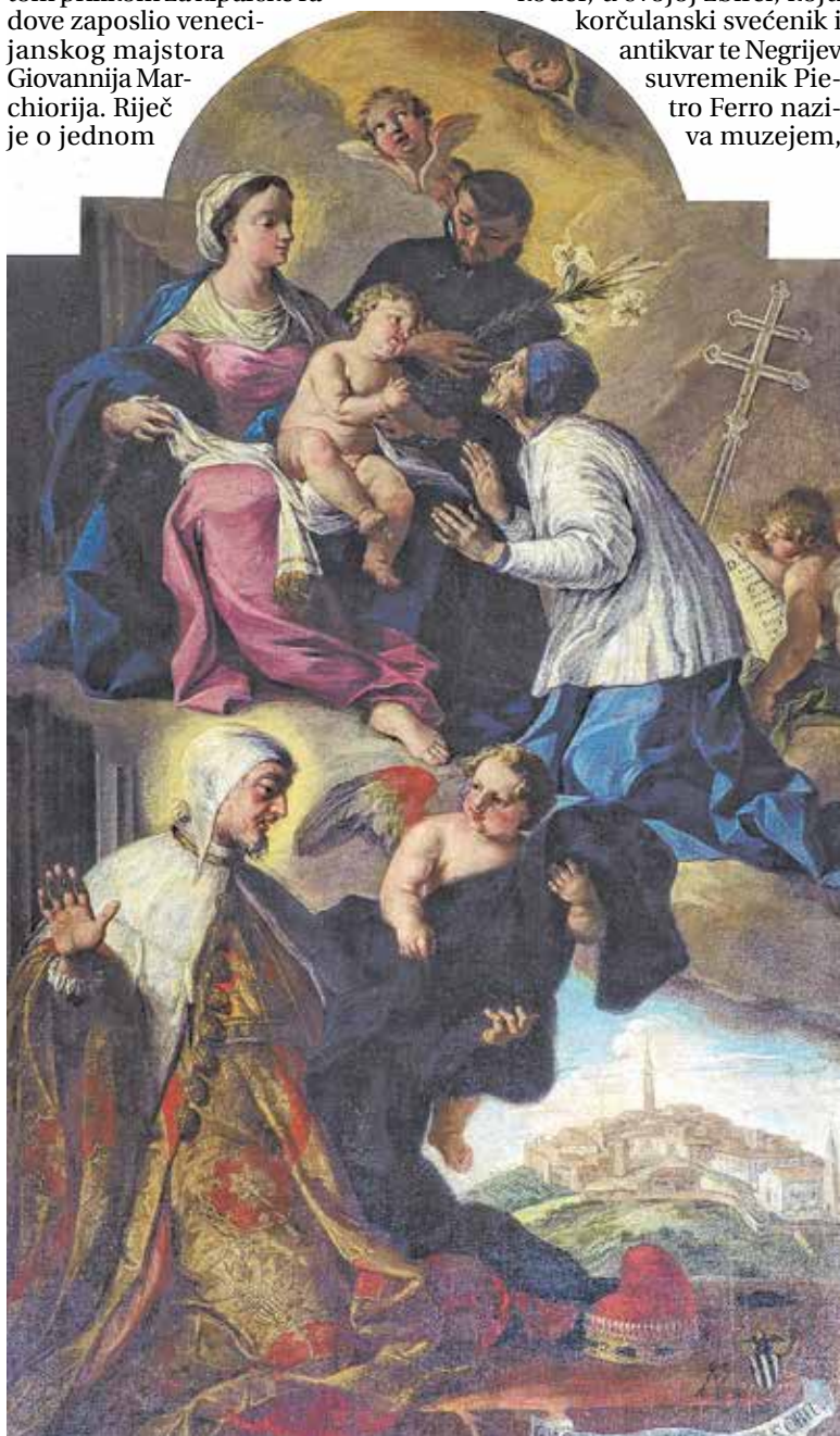
Santo Piatti, »Bogorodica s Djetetom i svecima«, crkva sv. Servula, Buje

Z a biskupa Negrija slobodno se može kazati kako uvodi prosvjetiteljsku misao na područje Istre i općenito donosi suvremene kulturne obrasce intelektualne elite Apeninskog poluotoka s kojom je bio u kontaktu kako uživo, tako i epistolarnim putem. Od tuda proizlazi i njegov interes za starine te za proučavanje povijesti. U riječkim i venecijanskim bibliotekama i arhivima čuvaju se još uvijek neobjavljeni Negrijevi rukopisi u kojima popisuje epigrafske natpise u Poreču