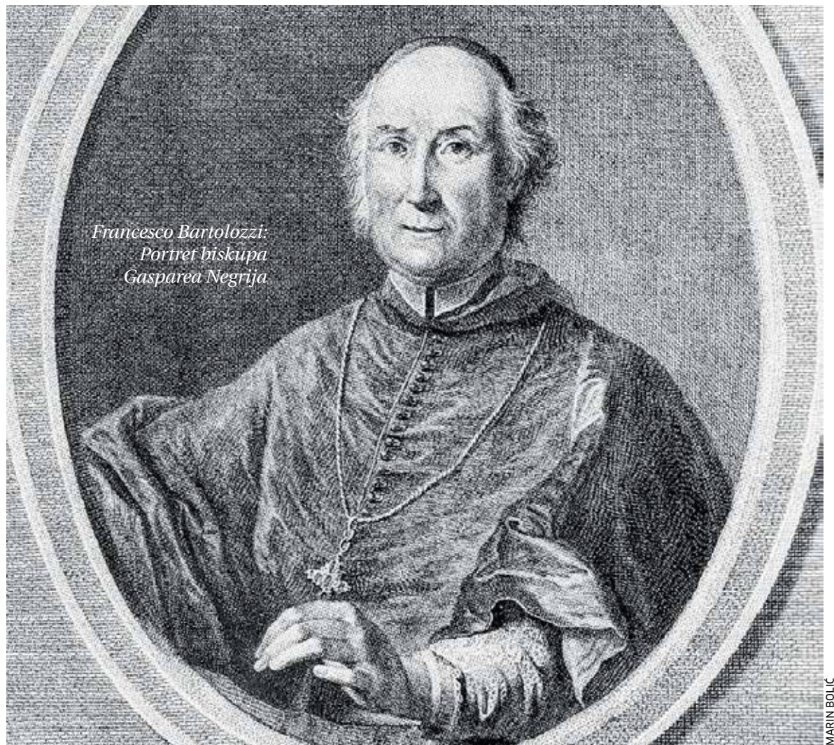
Francesco Bartolozzi: Portret biskupa Gasparea Negrija

- Za katedralu u Poreču, najvjerojatnije ponovo Negri, kod već spomenutog slikara Camerate naručuje sliku »Bogorodica s Djetetom, sv. Maurom i Eleuterijem«, koja je premještena te se danas nalazi u porečkoj crkvi svetog Eleuterija. Biskup Gaspare Negri bio je i pasionirani kolekcionar te je zabilježeno da je u kasnije raspršenoj zbirci imao slike renomiranih umjetnika poput Tintoretta, Veronesea, Parisa Bordona, Palme Starijeg, Pietra Liberija, Gregorija Lazzarinija. Također, u svojoj zbirci, koju korčulanski svećenik i antikvar te Negrijev suvremenik Pietro Ferro naziva muzejem,